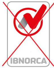
(x)Uso incorrecto "No indica la norma de certificación"

En caso de que se disponga dos o más certificaciones integradas, por ejemplo, ISO 9001 + ISO 14001, y el alcance sea idéntico en los sistemas, se puede optar por utilizar un logotipo versión vertical por norma o un logotipo versión horizontal donde se plasme las normas certificadas.