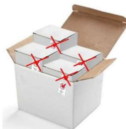
Uso correcto en el envase secundario (x) Uso incorrecto en envases primarios

La marca IBNORCA, en ningún caso, puede reproducirse directamente sobre los productos o sobre el embalaje primario de los mismos. (Se entiende por embalaje primario, aquel que contiene la unidad de venta), o de ninguna manera que pueda interpretarse que denota la conformidad del producto.