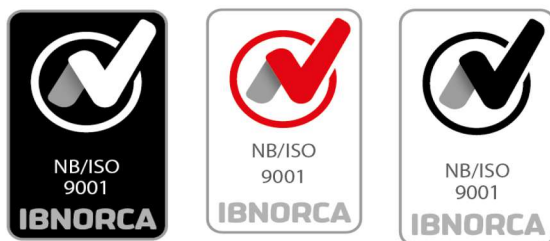
Aplicación de logos correctos

Los colores del Logo IBNORCA se definen en tres tonos diferentes con el fin de que puedan utilizarse en diferentes fondos donde se vaya a imprimir.