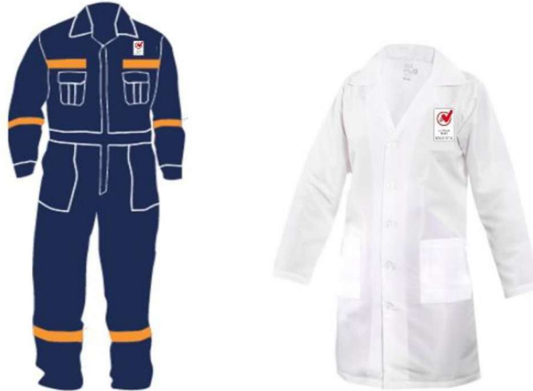
Usos correctos en ropa de trabajo

Es permitido el uso del logo en la ropa de trabajo para dotación del personal, siempre y cuando el personal se encuentra dentro del alcance.