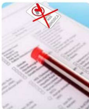
(X) Uso incorrecto en informes de ensayo/prueba/laboratorio/inspección

La organización cuyo producto/servicio es un documento (certificado, plano, informe de ensayo/prueba de laboratorio, de calibración, inspección, etc.) NO PODRÁ incluir la marca IBNORCA en dichos documentos.