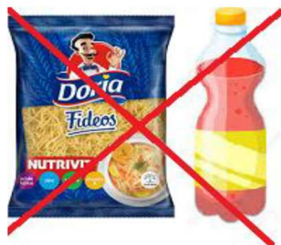
(x) Usos incorrectos